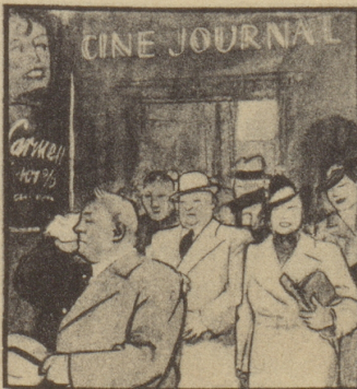
Die Kinobesucher sind noch ganz benommen von allem Gesehenen und von der Hitze im Saal. Draußen geht ein kalter Regen nieder.

Manch Fräulein tut nach langen Wegen Sich Rot auf Mund und Wangen legen.