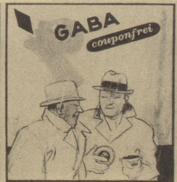
„Der Schirm ist gut, aber mir sind meine Gaba noch wichtiger. Bitte, bedienen Sie sich!“ Ob's windet, regnet oder schneit, Gaba schützt vor Heiserkeit!