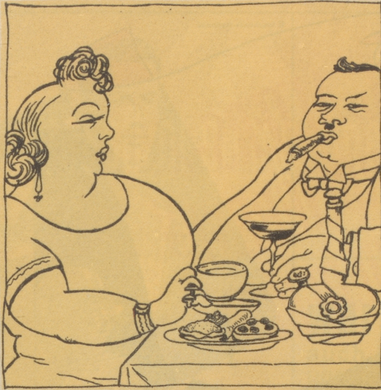
1940 Rheumatisme und Buchweh!