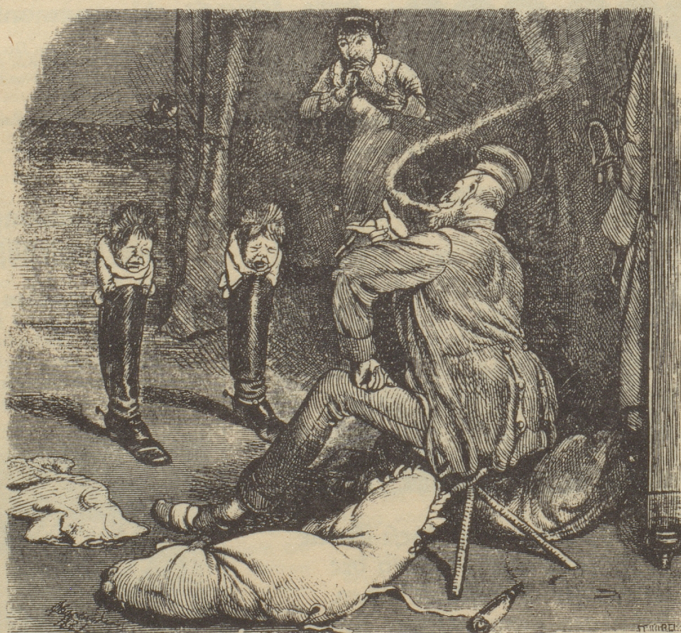
Des Kriegers Kinder. „Unsere Zwillinge werden Prachtsoldaten — sie stehn bereits in Reih und Glied!“

«Jo, aber ersch dia arma Chaiba, wo no öppis drin gha händ.» Lt. Sch.