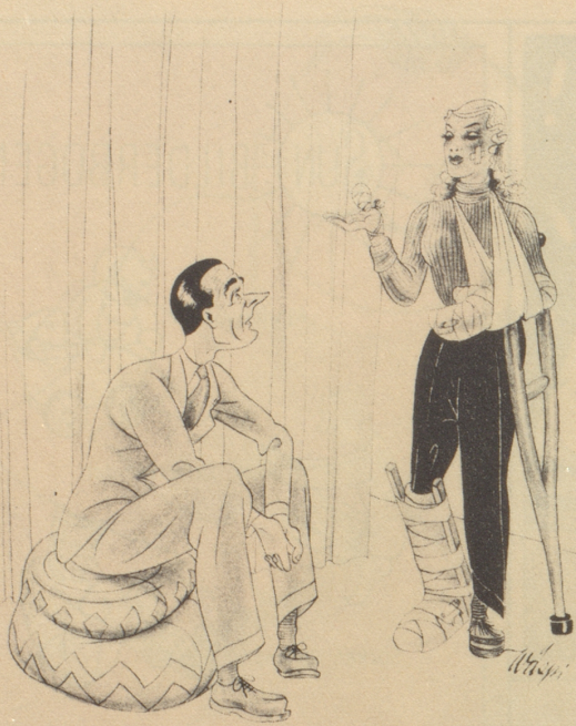
„Weisch ich tue mis neu Après-Ski-Kostüm usprobiere.“