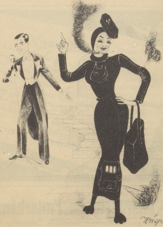
„s neueschte Wintermodell: Dauerbrenner!“