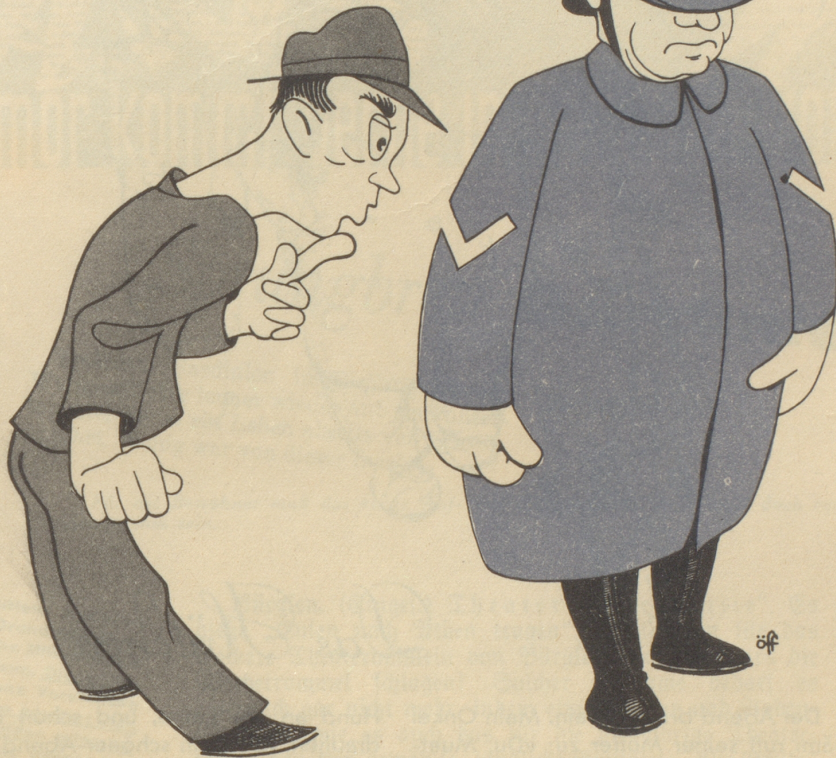
Die sonderbaren Gradabzeichen der Basler Polizei!

„Isch etz ächt das e Verkehrspolizischt oder e V-Propagischt??“