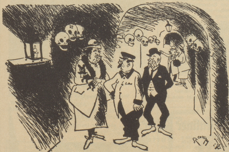
In den Katakomben

Sie hatten einen feinen Nachmittag. Das Gewehr war wirklich nicht geladen.