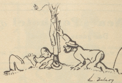
Der Übergangsmantel geht auf einen andern über.