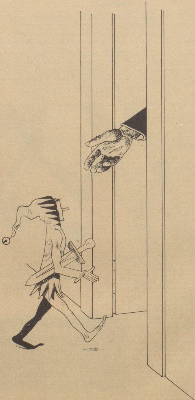
Das Kriegswirtschaftsamt und der Nebelspalter (siehe Basler Mustermesse)

Das ist fürwahr kein staubiges Amt, Das auch den kleinen Schalk, weil er es ehrlich meint, In seine ernste Stube lädt.