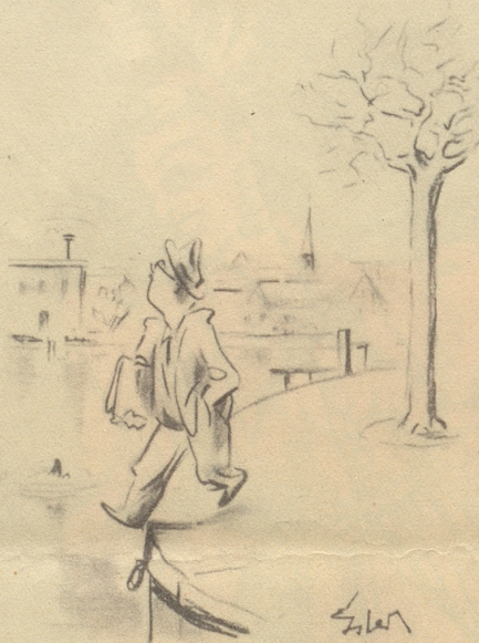
Gefahren aus der Luft

«Ein mächtiger Herzog wollte die Schweizer bekriegen. Er hielt mit seinen Räten Ratschlag, wie man die Sache anstellen sollte, daß man zu ihnen ins Land käme. Nun hatte der Herr einen kurzweiligen Narren, den fragte er auch scherzweise, was er dazu räte. Der Narr antwortete: Es gefällt mir garnicht. Ihr erratet alle, wie man hinein, und keiner, wie man wieder herauskommen möge. Es war dies eine gewisse Prophezeiung des Narren, denn der Herzog wurde mit den Seinen von den Schweizern erschlagen.» h.