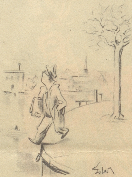
Gefahren aus der Luft

«Ein mächtiger Herzog wollte die Schweizer bekriegen. Er hielt mit seinen Räten Ratschlag, wie man die Sache anstellen sollte, daß man zu ihnen ins Land käme. Nun hatte der Herr einen kurzweiligen Narren, den fragte er auch scherzweise, was er dazu räte. Der Narr antwortete: Es gefällt mir garnicht. Ihr erratet alle, wie man hinein, und keiner, wie man wieder herauskommen möge. Es war dies eine gewisse Prophezeiung des Narren, denn der Herzog wurde mit den Seinen von den Schweizern erschlagen.» h.