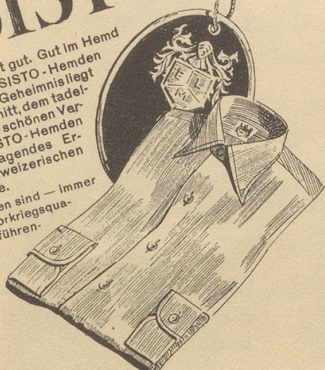
RESISTO das klassische Hemd des eleganten Herrn

Gut im Strumpf ist gut. Gut im Hemd noch besser. Mit RESISTO-Hemden sind Sie's immer. Das Geheimnis liegt im vorbildlichen Schnitt, dem tadellosen Sitz und in der schönen Verarbeitung. RESISTO-Hemden sind ein hervorragendes Zeugnis der schweizerischen Wäsche-Industrie. RESISTO-Hemden sind — immer noch in guten Vorkriegsqualitäten — in den führenden Fachgeschäften erhältlich.