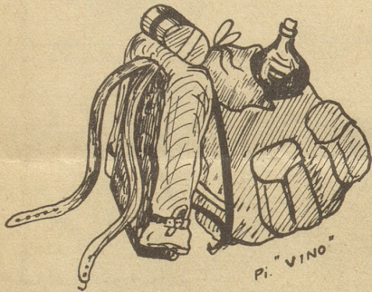
Wie ich mir den zweiteiligen Tornister vorgestellt hatte!