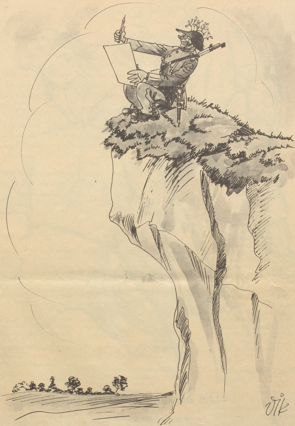
1. Bild aus Diks Kriegs-Skizzenbuch