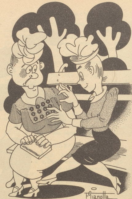
Dactylographin trifft Dame mit Knöpfen

Ich will nun nicht etwa eine große Kritik vom Stapel lassen (oh nein), denn ich bin ein friedlicher Mensch und möchte mich nicht mit Dir streiten. Im Vertrauen gesagt: ich bin nicht ganz sicher, ob meine Anklage begründet ist. Aber ich muß es Dir sagen. Obwohl es mir schwer fällt. Also hör zu. Ich hätte (wie sag ich's meinem Kind), also ich hätte I. M. (Ihre Majestät) geschrieben und nicht S. M. (Seine Majestät).