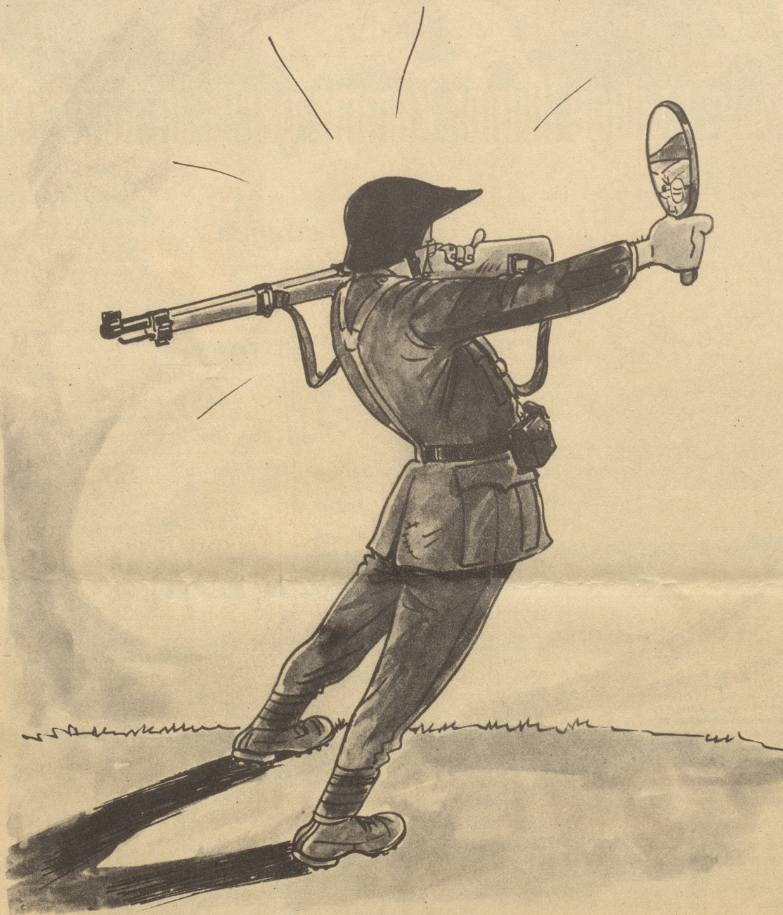
2. Bild aus Diks Kriegs-Skizzenbuch