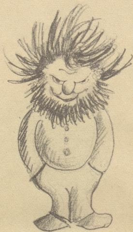
Siehst Du den Mann mit wilder Mähne? Im Herzen ich ihn milder wähne.

Für den «Nebenspalter» herausgelesen von G. E.