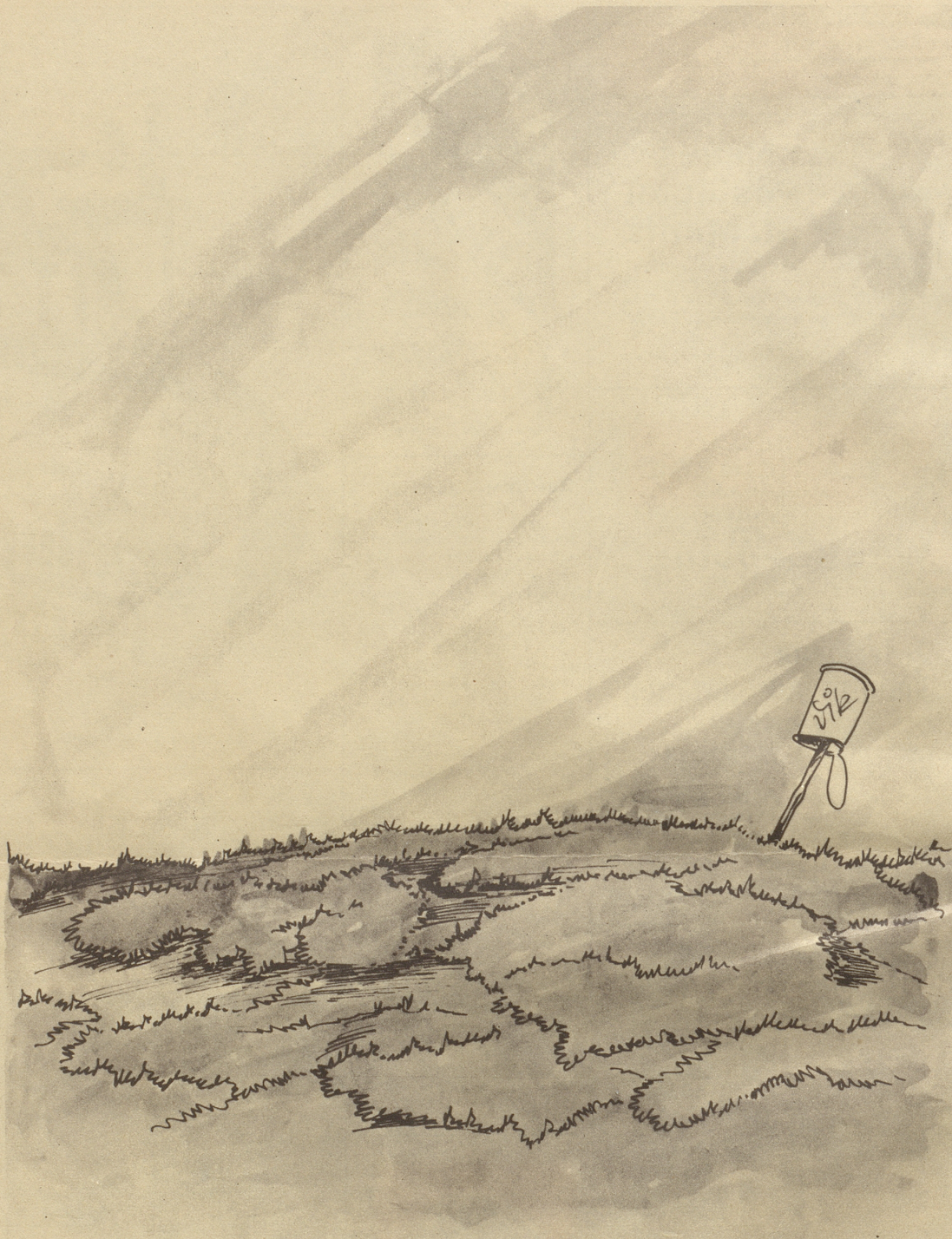
4. Bild aus Diks Kriegs-Skizzenbuch