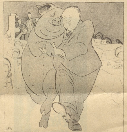
Auch der Schwede bewegt sich in einer neuen Gefühlswelt! Söndagsnisse-Strix

«Siehst du, wenn ich ans Heiraten denken will, muß ich auch verdienen. Ich habe eine Stelle. Aber wenn ich die englische Sprache richtig, korrekt aussprechen lerne, so daß man versteht, was ich sage, dann verliere ich meine Stelle. Ich bin doch Sprecher bei Radio Bern und muß dort immer die englischen Schlagertitel der Tanzkapellen ansagen. Wenn man mich ein einziges Mal versteht, dann fliege ich! Verstehst du?» Fridolin