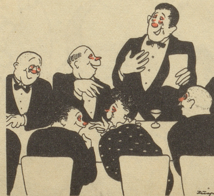
Die Heuschnüpfler feiern das Ende der Heuernte