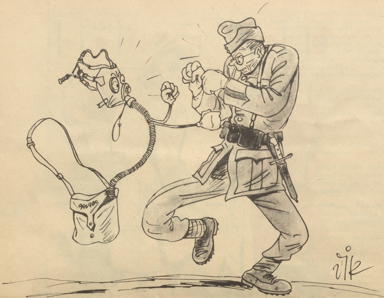
6. Bild aus Diks Kriegs-Skizzenbuch