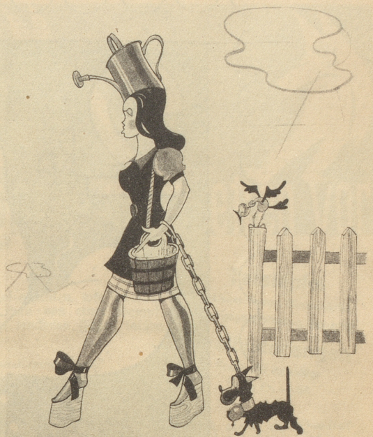
In Sache Möödeli