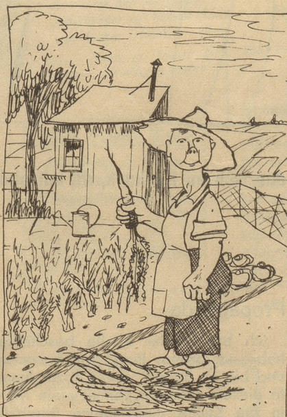
„Ich ha mis eige Gmües.“