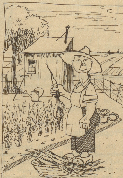
„Ich ha mis eige Gmües.“