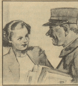
„Haben Sie nicht Angst vor Ansteckung?“ fragt sie, „Sie haben doch einen schweren Beruf.“