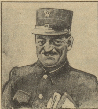
Der Briefträger ist gut Freund mit seinem ganzen Bezirk; er kennt alle und alle kennen ihn.

«Sowieso, aber num einisch ume-tanzt, e Whisky gno u grad wieder gange.» Tok