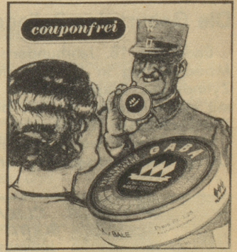
„Oh, ich habe immer eine Schachtel Gaba bei mir; Sie sollten auch Gaba im Haus haben, gerade in dieser Jahreszeit, denn Gaba beugt vor.“