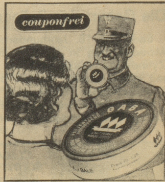
„Oh, ich habe immer eine Schachtel Gaba bei mir; Sie sollten auch Gaba im Haus haben, gerade in dieser Jahreszeit, denn Gaba beugt vor.“