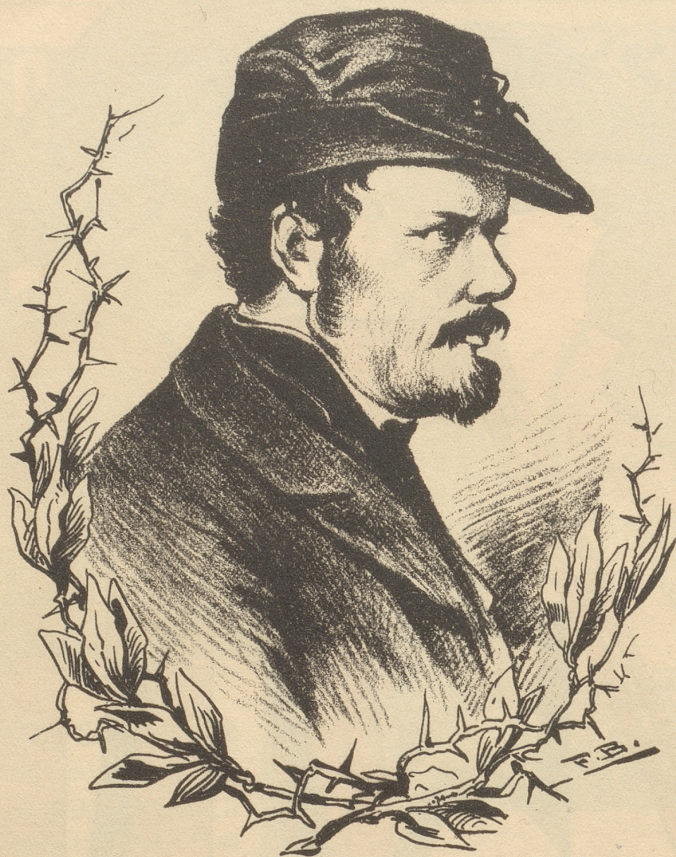
Porträt Distelis von F. Boscovits.