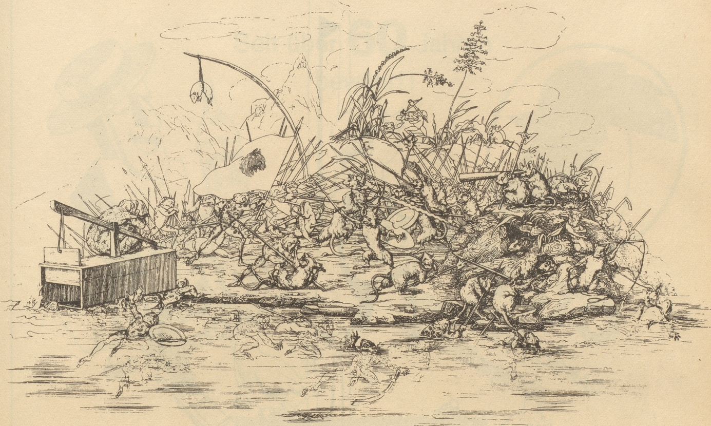
Frosch-Mäusekrieg. Lithographie, Martin Disteli-Museum Olten.

Um seine persönlichen, materiellen Angelegenheiten stand es nicht gut, und auch die ihm 1835 übertragene Lehrerstelle für Zeichnen an der Solothurner Kantonschule konnte den allmählichen Verfall nicht mehr aufhalten. Krank, arm und verkommen starb er am 18. März des Jahres 1844.