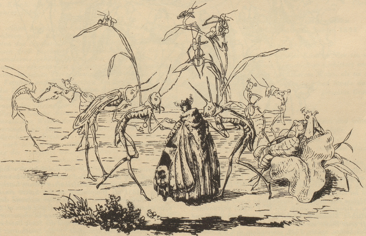
Ballsszene, Federzeichnung, Kunstmuseum Solothurn.

man im feinen und sicheren Strich Distelis etwas von der Zeichnung des Illustrators der Nibelungen. Allerdings, dessen oft spröden, trocken wirkenden Historismus wußte der aggressive Solothurner ins Saftige, Lebensvolle und Volkstümliche umzuformen, die höfische Distanziertheit ersetzte