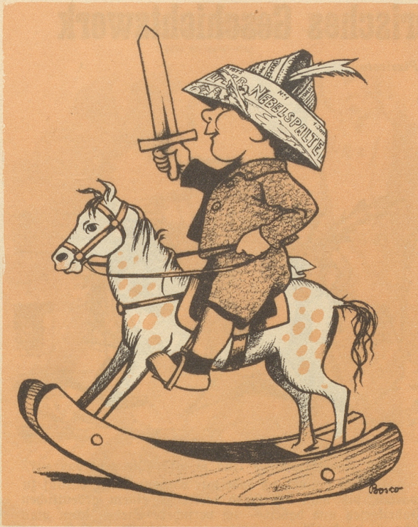
Unser Mitarbeiter Boscovits jun. und die erste Nebelspalternummer anno 1875