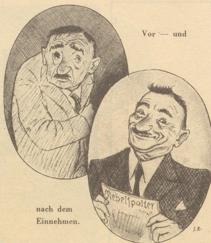
nach dem Einnehmen.

«Nein», entgegnete der König, «sie wird größer sein, — denn sie wird länger bestehen.» (Deutsch von E. W.)