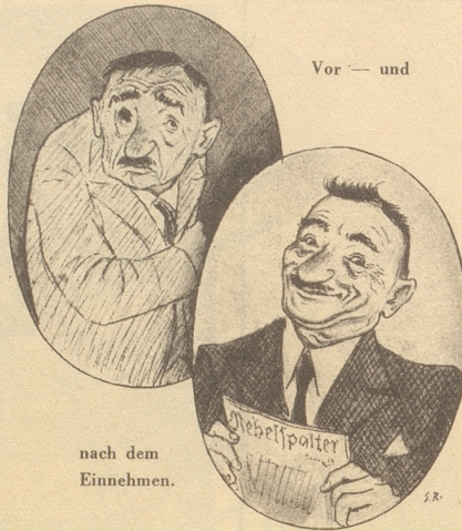
nach dem Einnehmen.

«Nein», entgegnete der König, «sie wird größer sein, — denn sie wird länger bestehen.» (Deutsch von E. W.)