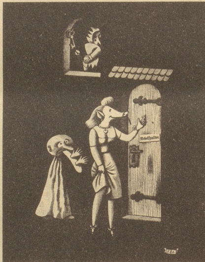
Der Nebelspalter meidet die Zote und den billigen Spott