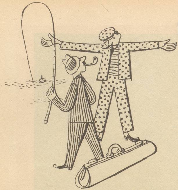
„Soo groß isch er gsiil!“