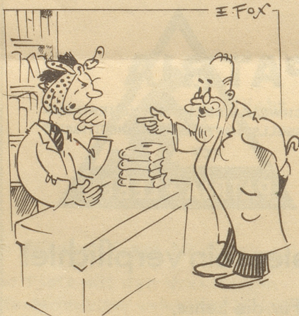
Im Bücherladen «Haben Sie Schopenhauer?» «Nein, Zahnweh!»

Auflösung: Imene freie Land dörf me no sini Meinig säge!