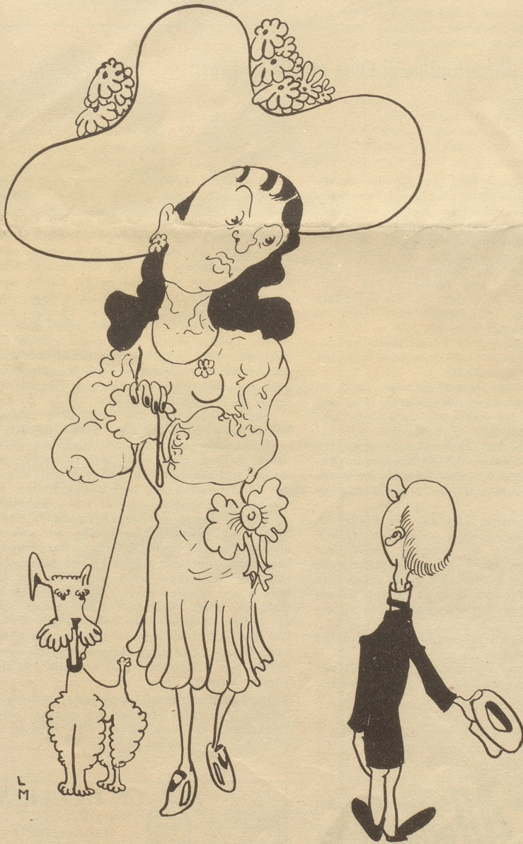
„Äggsüsi Froilain, hänzi Ihres Hündli sälber glismet?“

«Chasch danke, in Diänscht nimmt mr kaini Maitli, nummä Rösser!» U. B.