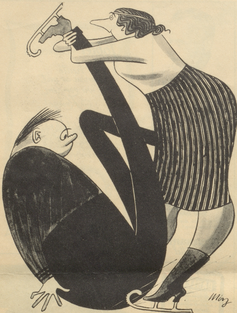
Was tuts - verschrupft auch mancher Schwung - Ein ganzes Volch wird wieder jung!