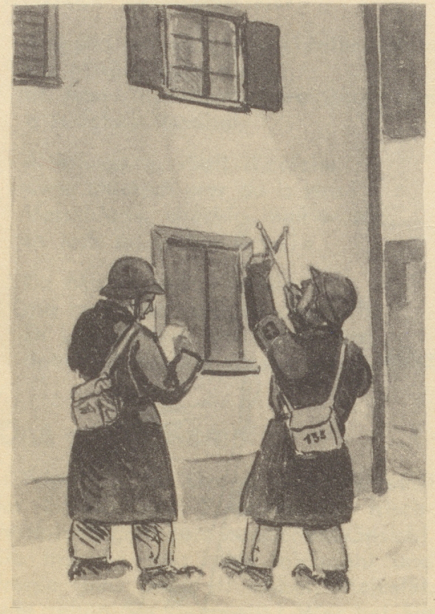
Die neue Geheimwaffe unserer Luftschützer

Nein, ich bin nicht durch die Einleitung der Meldung, die ich glossiert habe, irreführt worden. Sondern diese Einleitung, darin «gut informierte Stellen meinen, daß es sich bei