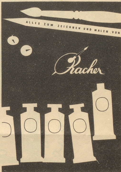
RACHER & CO. PELIKANSTR. 3 ZÜRICH TEL. (051) 231688

Gerbergasse 35 A Cendrillon Bälliz 32 Usteristr.- Lintheschergasse 8 rue du Marché 10