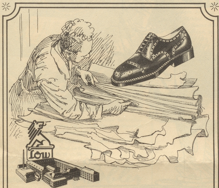
LÖW UND PROTHOS AG. OBERAACH, THG.