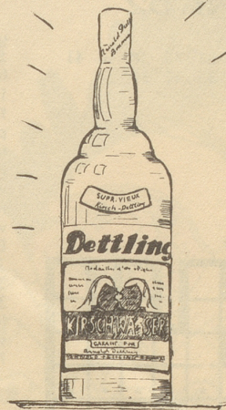
Arnold Dettling Brunnen

A. DÜRR & CO. AG. ZÜRICH Bahnhofstr. 69 „zur Trulle“ Bahnhofplatz 6