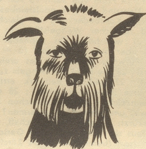
Alex heisst dies treue Hundetier.

«Oh, Mama — lueg: de säb Ma det hinkt mit em Chopf!» Boll.