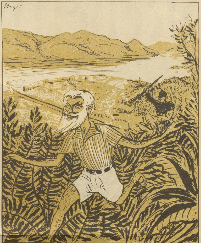
In Ascóna macht die Polizei Jagd auf Träger kurzer Hosen,

Mir müend üs halt wieder nööcher- cho ... aber nüd zum enand de Grind verschloh! Pizzicato