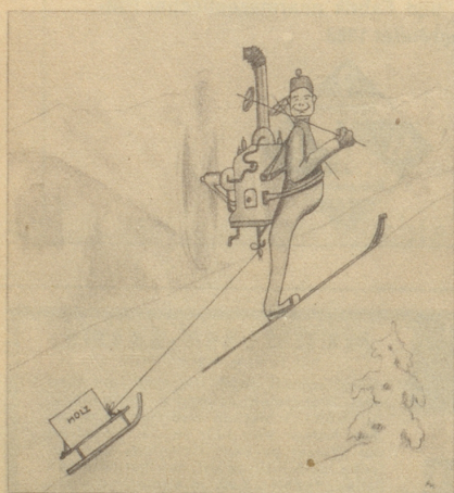
Neue Erfindung für den Wintersport Der individuelle Holzgaskiliftersatzantreiber

Wer schreit am lautesten nach Freiheit? Auflösung: «Die, welche die andern diktieren wollen!»