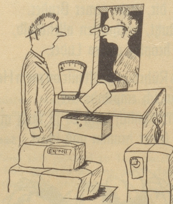
«Sie, wäred Sie so guet und würdet Sie mir das Formular usfülle, i ha mini Brülle vergässe!» Sonntagszeichner Schmid

Da öffnete der Tote die Augen und lächelte müde: «Laßt nur, Kinder, ich gehe auch zu Fuß!» —ans-