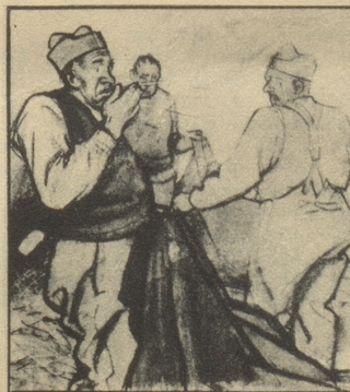
Und nun beginnt das übliche Morgen — Hust-Konzert — fast so unvermeidlich wie der weckende Korporal. Das kommt natürlich von dem langweiligen Strohstaub!