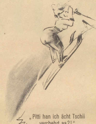
„Pitti han ich ächt Tschii verchehrt aa?!“

«Nein, ich weiß nur, daß der Hund mit dem Schwanz wedelt, wenn der Pfändungsbeamte zu ihnen kommt, und das genügt mir.» -ler