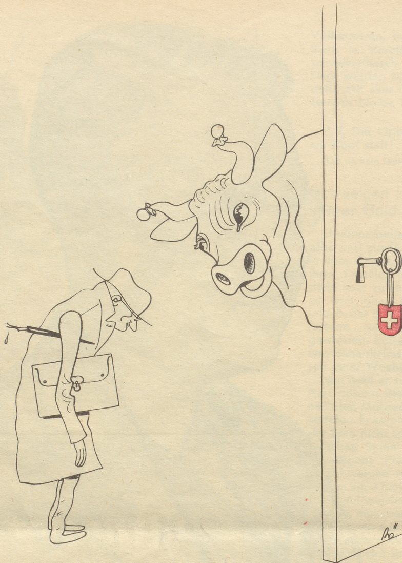
Der Beobachter hat sich an das Eidgenössische Justiz- und Polizeidepartement gewendet mit der Frage, ob es nicht an der Zeit sei, den billigen Jakob Schaffner auszubürgern.

Ja der Schaaggi! Wohl verrät er Land und Haus und Hof der Väter, Aber uns tropft ab dem Bart Milch der frommen Denkungsart.