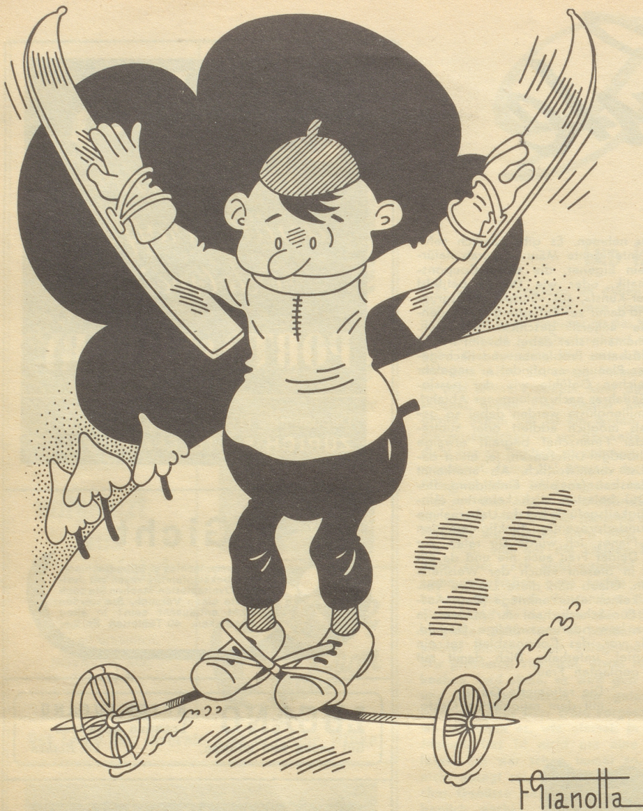
Der Mann, der die Gebrauchsanweisung verloren hat