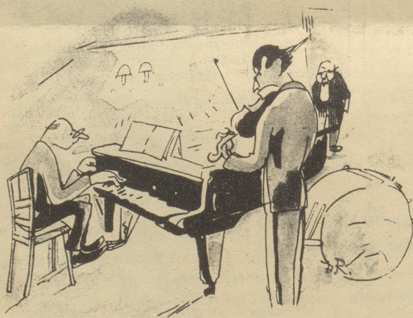
„Jetzt können wir ruhig Beethoven spielen, es ist ja kein Knochen mehr im Lokal.“