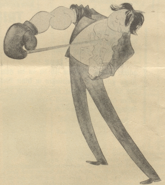
Kraft und Gefühl, der Musikboxer wäre eigentlich zeitgemäß.