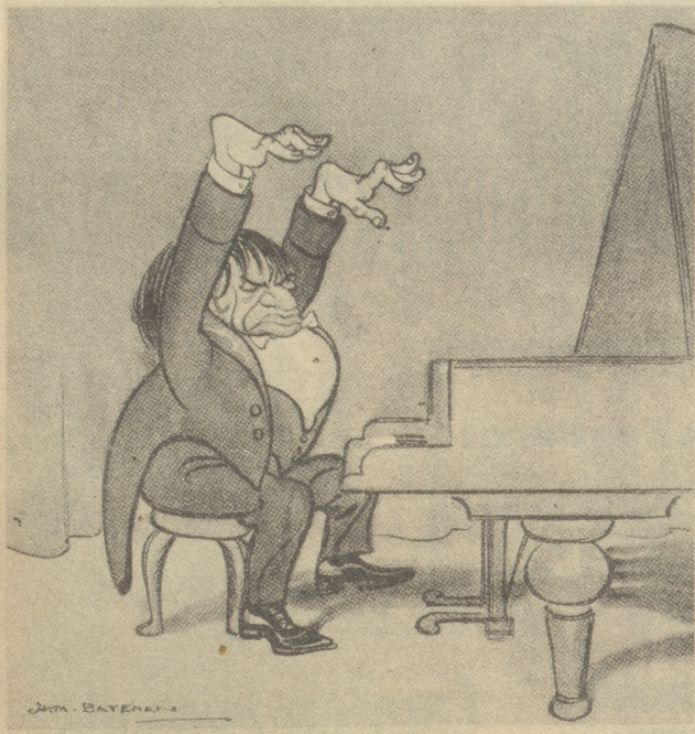
Ein Jubiläum: Zum tausendsten Male die „Appassionata.“