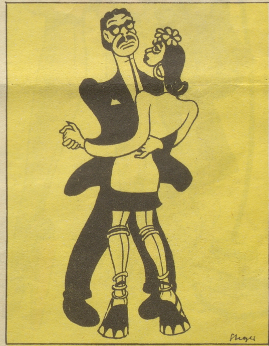
8 ... und hielt schließlich in den intellektuellen Kreisen Neandertals Einzug.