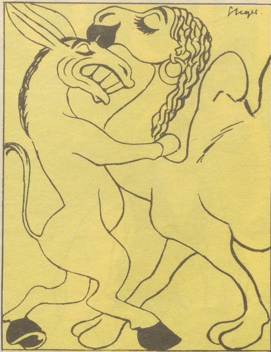
5 Der Swing kennt weder Klassen- noch Rassenunterschiede.