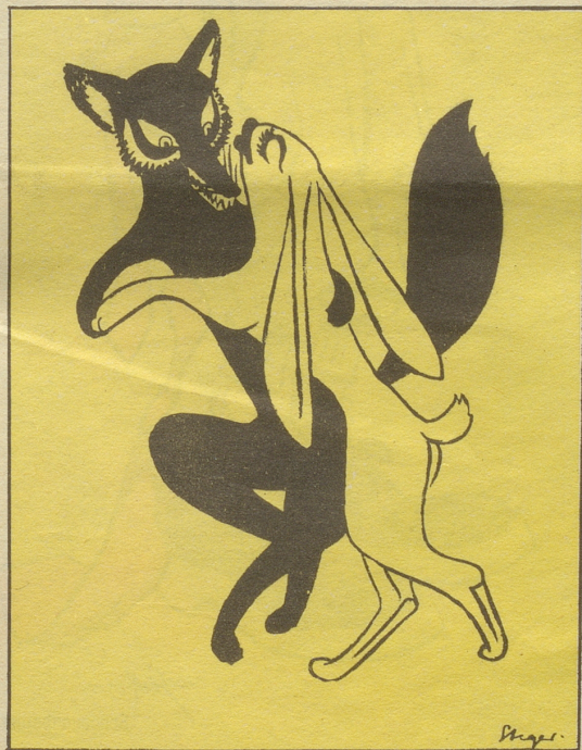
7 Dann wurde der Swing immer nobler ..