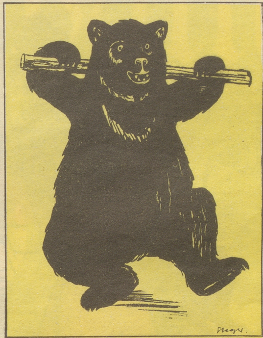
6 Einzig der Bär machte dieses Glöl nicht mit und tanzte weiter den Tanz seiner Urväter: den urchigen Ländler.