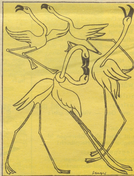
4 . . . und daraus entwickelte sich schließlich der moderne Swing.