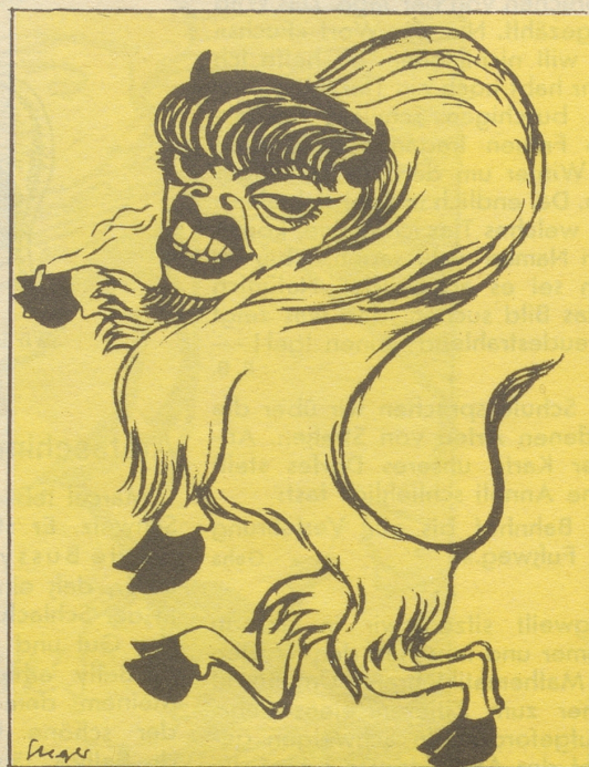
2 Viele Jahrtausende später lebte an den Gestaden eines helvetischen Sees das Büffelweib Dolly Buffalo-Bison. Ihr mondänes Wesen erregte Anstoß bei ihren Verwandten. Sie kehrte den kleinbürgerlichen Verhältnissen den Rücken und wurde Sängerin in einem Nachtlokal des wilden Westens.