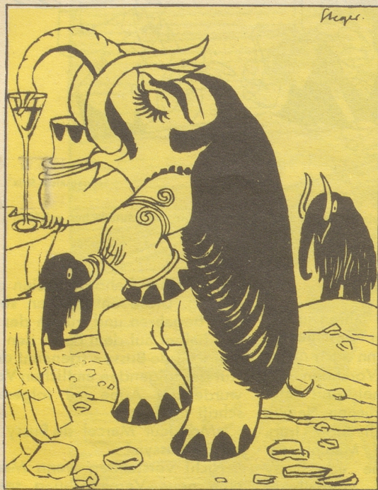
1 Im Jahre 391944 v. Chr. erfand der Mammut Chang die Swingfrisur und einige Jahre später den Swing. Leider kam bald darauf die Sintflut und setzte dem ganzen Zauber ein jähes Ende.