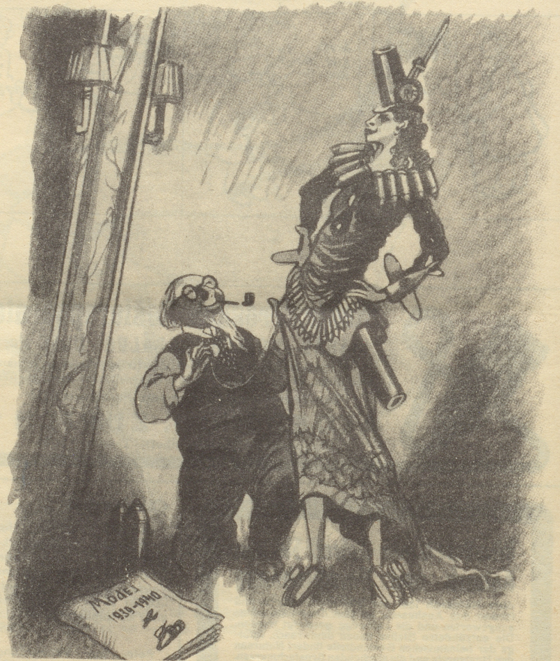
Рис. М. Храпковского