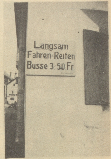
Da isch me schöö am Seil miteme alte Gaul!

Hei, ging da ein Aufschauern durch die Mannen. Der Fourier schlug seine Absätze zusammen und kam mit seiner Schuhschachtel voll Söcklein dahergerannt. Es ging nicht lange ... so hatte ich vier funkelnege neue Fünfernötlein in der Hand. Jetzt aber los, wie die Kugel aus dem Rohr, zum nächsten Bäcker. Mit einem großen Sack voll Makrönli und Bretzeli und einem Nötlein weniger stieg ich bald wieder die ausgetretenen Stufen herunter und begab mich auf die Suche nach einem idyllischen Platz für meine Galgenmahlzeit. Diese wurde auf einer Holzbeige, plaziert zwischen einer Blumenwiese und einem Murbelbach, abgehalten. Genießerisch drückte ich die weißen, braunen und gelblichen Guetzli in