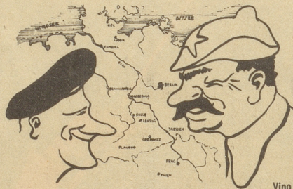
Frontverlauf Mitte April 1945!

Ein Wehrwolf ist ein Wolf, der sich in den eigenen Schwanz beißt! Kobold